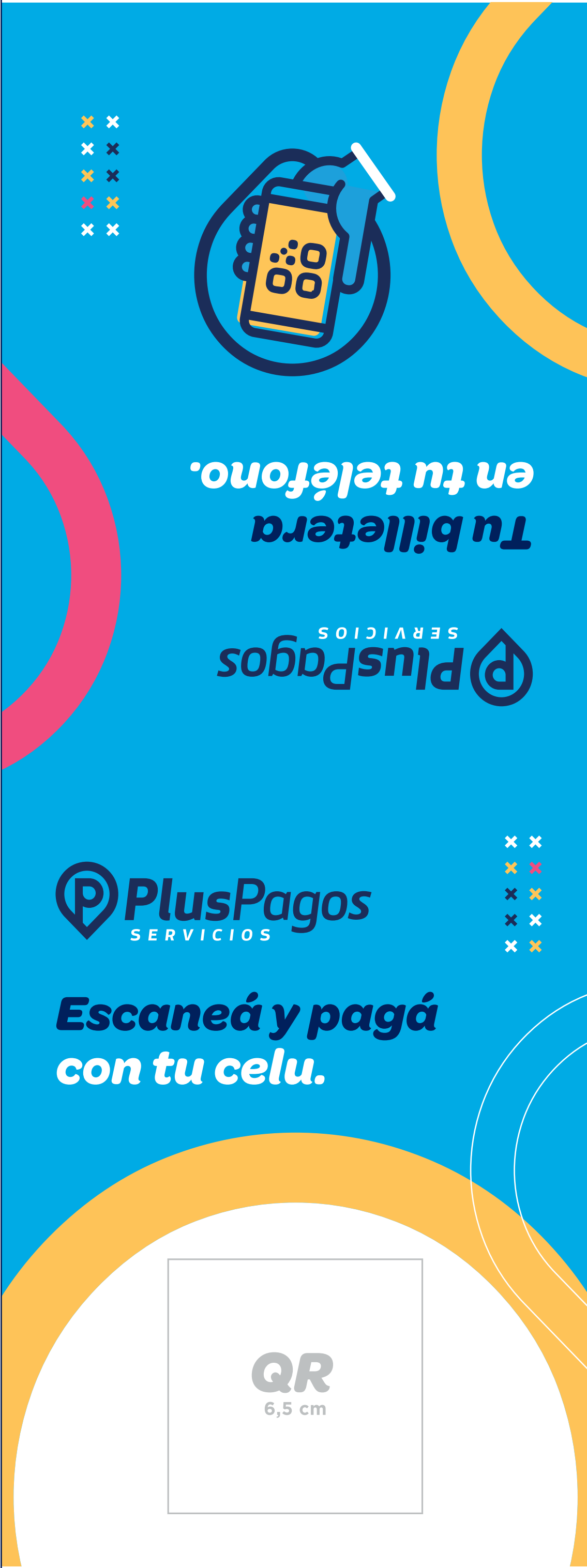
Table tent 15x20 cm cerrado